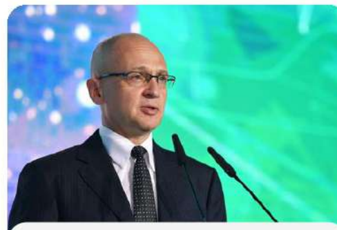
Кириенко Сергей Владиленович

Первый заместитель Руководителя Администрации Президента Российской Федерации